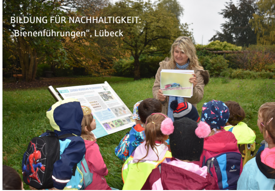
BILDUNG FÜR NACHHALTIGKEIT: „Bienenführungen“, Lübeck

Der DAVID ist ein Wettbewerb, der jene Projekte in den Mittelpunkt rückt, die in der öffentlichen Wahrnehmung manchmal etwas zu kurz kommen. Das Besondere ist, dass die Preisträgerinnen und Preisträger des Vorjahres Mitglieder der Jury sind. Auf diese Weise erleben sie die ganze Bandbreite der Einreichungen, bekommen Einblick in die Entscheidungsprozesse der Jury und bringen sich aktiv mit ein.