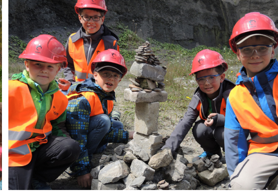
UMWELTBILDUNG: „Ferien im Jurameer“, Balingen

Alle Einreichungen zum DAVID können für den Sonderpreis berücksichtigt werden. Dieser wird vergeben, wenn sich ein Projekt nach Einschätzung der Jury in besonderer Weise (in seiner Wirkung für eine Sparkassenstiftung) auszeichnet.