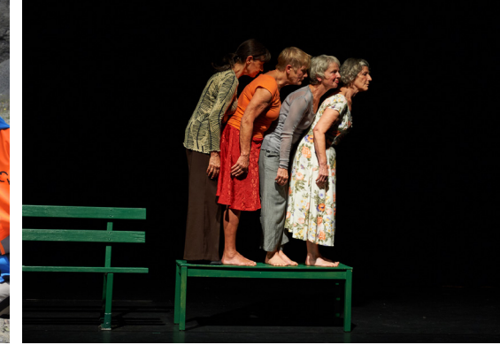
BILDUNG + SOZIALES: „Aktiv mit Demenz“, Bremen

„Durch den DAVID ist unser Bienenschutz-Projekt auch in unserer Wahrnehmung sehr groß geworden. Wir sehen seine Wichtigkeit und haben uns angeschaut, was wir tun können, um es noch attraktiver zu gestalten.“