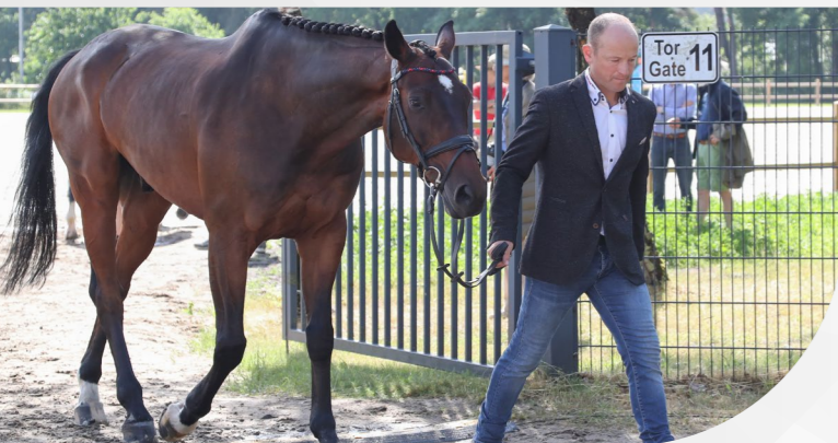
▼ Michael Jung führt Chipmunk zum Check.